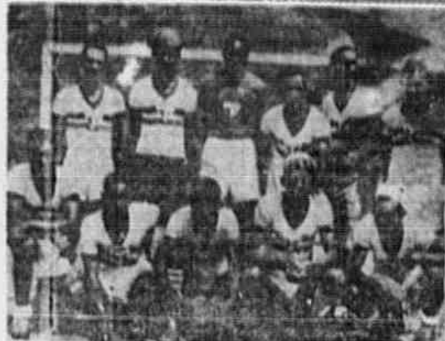
A valorosa equipe do Abasté Futebol Clube, um dos participantes do CAMPEONATO POPULAR, e grande cortejo dos clubes independentes, cujo desenvolvimento empolga a cidade