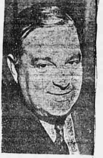
Sr. Fiorella La Guardia