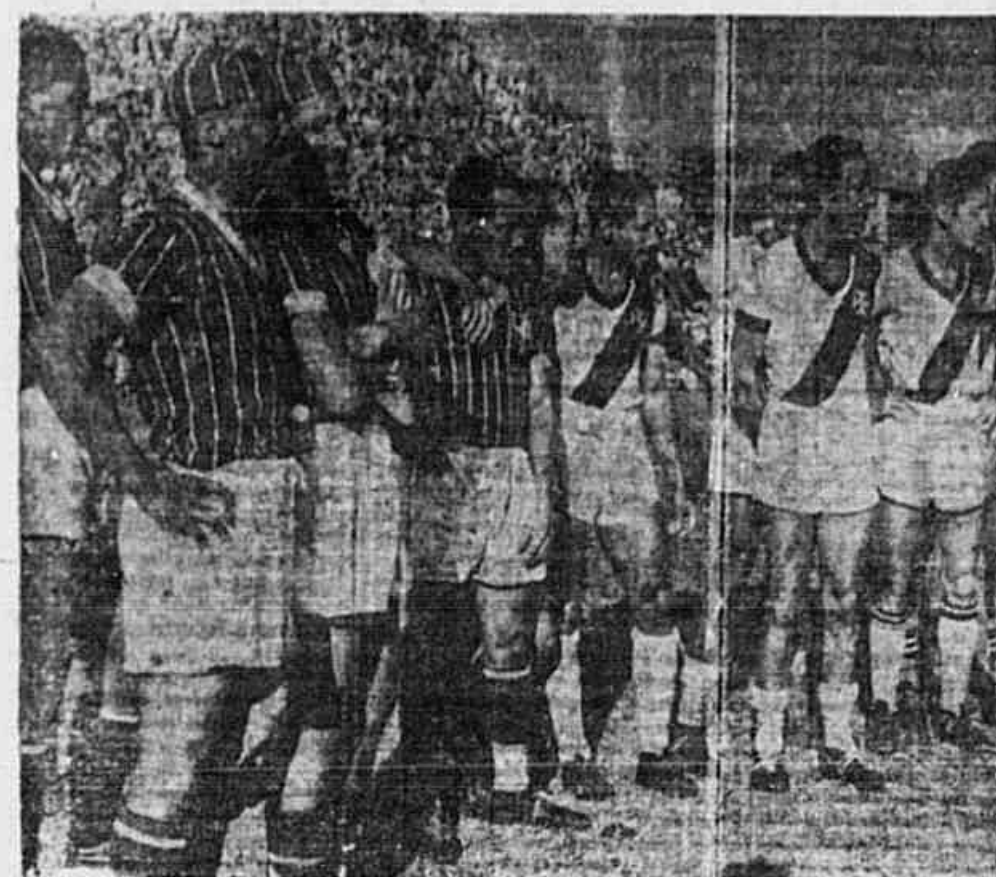
Cracks do Fluminense e do Vasco que deverão ingressar na "Casa do Atleta"

SEGUNDO ANIVERSÁRIO DO RAMOS F. C. A 22 de abril de 1945 cerca de cem jovens desportistas, reuniram-se numa das salas do Colégio Cardenal Arcoverde, em Ramos, para tornar uma realidade concreta a idealização há muito acalentada de fundar mais um clube desportivo para proporcionar aos jovens da subúrbia mais atrativo da Leopoldina a oportunidade de se adestrarem fisicamente e recrearem o espírito, democraticamente unidos, com os olhos fitos na Independência política e econômica da pátria querida.