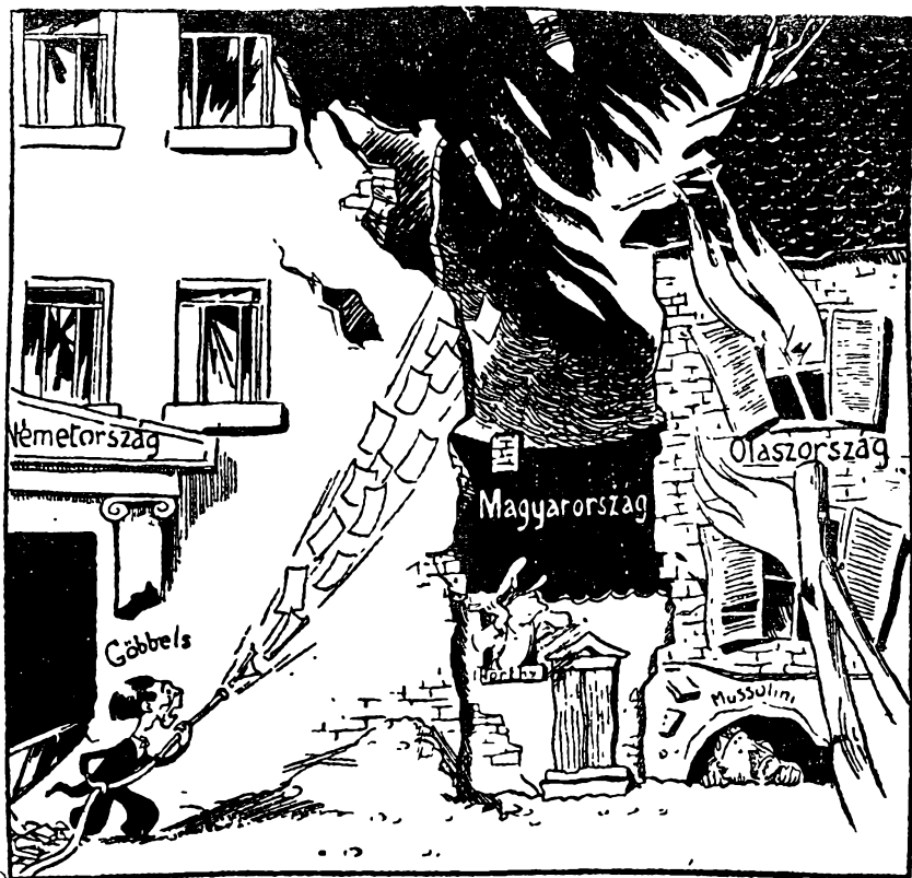
„A szomszéd háza már ég!” — Gúnyrajz az Igaz Szó 1943 június 17-i számából

jóslatokkal, propaganda-minisztérium felállításával akarta népszerűvé tenni a náci rablőháborút. Kállay is járt Hitler főhadiszállásán, megkapta a porosz vörös sasrendet, s utána „matematikai pontossággal” bejósolta tavaly nyárra a végső győzelmet, és közben a frontra vitte