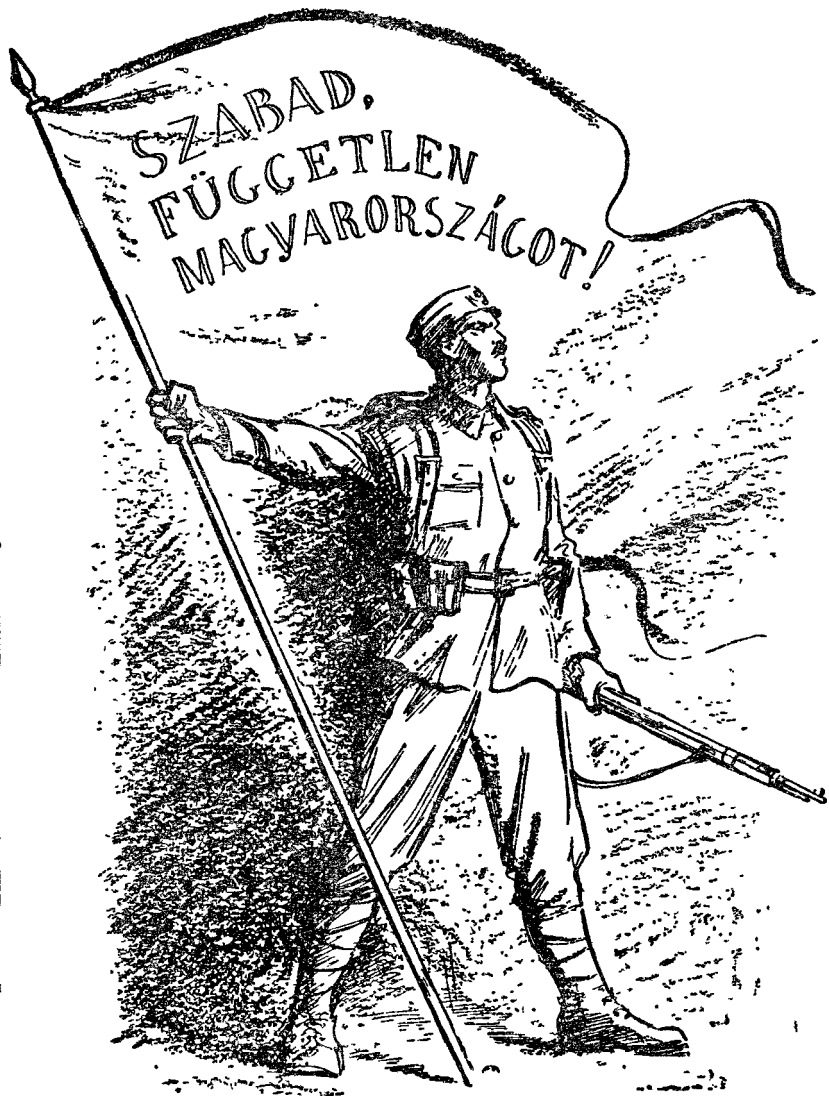
Rajz az Igaz Szó 1943 május 1-i számából