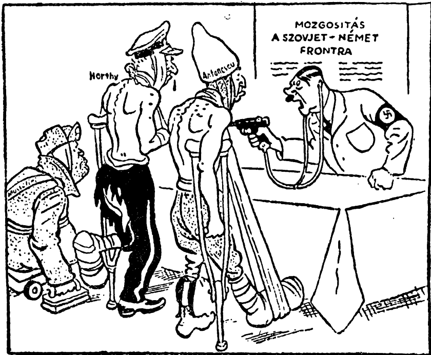
Gúnyrajz az Igaz Szó 1943 március 13-i számából

Az olaszok utolsó gyarmatukat: Libiát is elvesztették. Többmilliós szövetséges haderő megindult az európai második front megteremtésére. A fasiszta zsarnokok felett megkondult a halálharang. Hitler, Mussolini és cinkosaik rémuralmának végőrája közeledik.