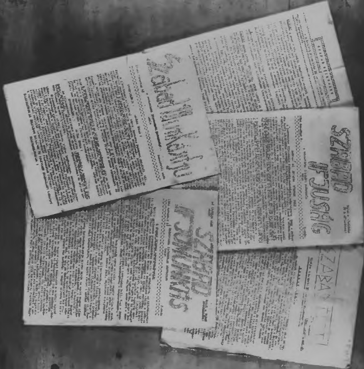
A Kommunista Ifjúsági Szövetség 1944-ben megjelent illegális lapjai

Magyar Kommunista Ifjúsági Szövetség 1944. évi 1. szám Budapest, 1944. január 15.